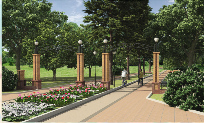
ВИДОВОЙ КАДР 2