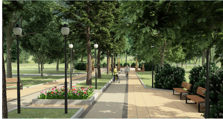
ВИДОВОЙ КАДР 1