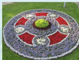
ЦЕНТРАЛЬНЫЙ ЦВЕТНИК (Вариант оформления 3)