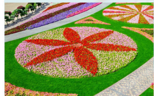
ЦЕНТРАЛЬНЫЙ ЦВЕТНИК (Вариант оформления 1)