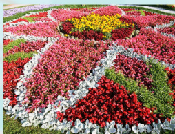
ЦЕНТРАЛЬНЫЙ ЦВЕТНИК (Вариант оформления 2)